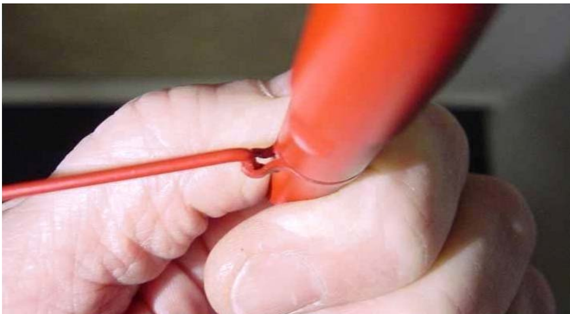
Tourner le bout de la buse à la main, jusqu'à atteindre la position de dégagement de la tige.